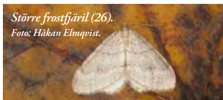
Större frostfjäril (26).