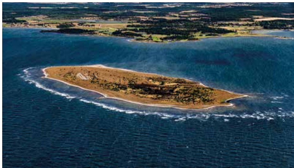
Fågelperspektiv på Utholmen, från sydväst.

ning och drivande sand har så småningom bundit de andra till huvudön där de nu är uddar och kustnära höjder. Utholmen däremot ligger inte i farozonen – mer än en kilometer av vatten skiljer den fortfarande från Kronholmen och till Västergarns hamn är det dubbelt så långt. Ut kommer man med egen båt, om man har någon, eller genom att anlita en av de nutida kustskepparna i Västergarns hamn. Att det var enklare förr är dock en sanning med viss modifikation. Under senare delen av 1800-talet kunde gotländska tidningsläsare regelbundet ta del av mer eller mindre hotfulla notiser som riktade sig till hugade besökare, som denna från 23 maj 1874 i Gotlands Allehanda: ”Af förekommen anledning får vänl. fästa all-