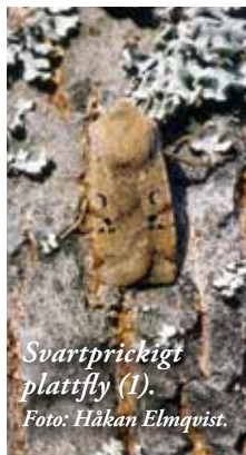
Svartprickigt plattfly (1).