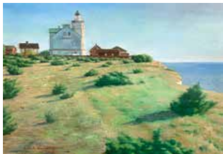
Fyrhuset, tidig sommarkväll. (Olja på duk.)