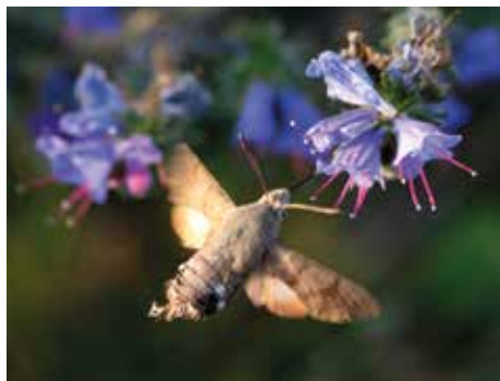
Större dagsvärmare (12).

12 cm är Sveriges största fjäril. Populärt för guiderna att kunna visa upp för besökarna när de stöter på en sådan. Fjärilen är nämligen ganska vanlig på Karlsö men kan vara svår att träffa på. Man får ge sig ut mitt i natten med lampa och kolla på blommor. Fjärilen besöker gärna syren, som det ju finns några buskar av i Hien, men även blåeld. Mindre snabelsvärmare (6), som också är vanligt förekommande, uppträder redan i skymningen och är därför lättare att få se.