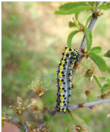
Larv av blåhuva (23).