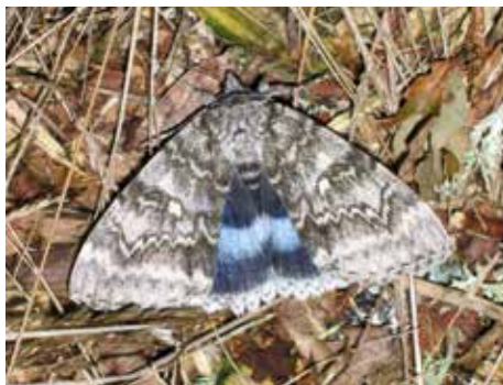
Blåbandat ordensfly (14).

Under hösten dyker några höstarter upp som blåhuva (22), lindmätare (24 och 25) samt både större frostfjäril (26) och mindre frostfjäril (27). Larver av blåhuva (23) och lindmätare har under sommaren hittats på vejkسل. Man kunde ju hoppas att dessa arter skulle öka och därmed hålla vejkسلn nere! Tyvärr är detta nog en from förhoppning då det redan borde ha skett. Men man kan i alla fall säga att det finns insekter som livnär sig på vejkسل även här på Stora Karlsö!