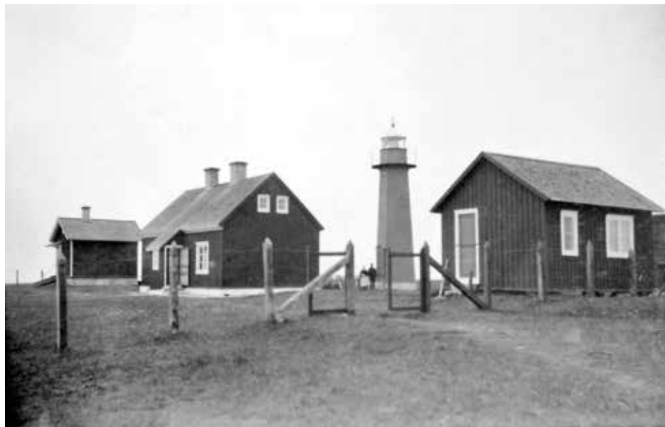
Utholmens fyrboställe omkring 1889.