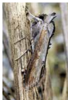
Asterkapuschongfly (17).