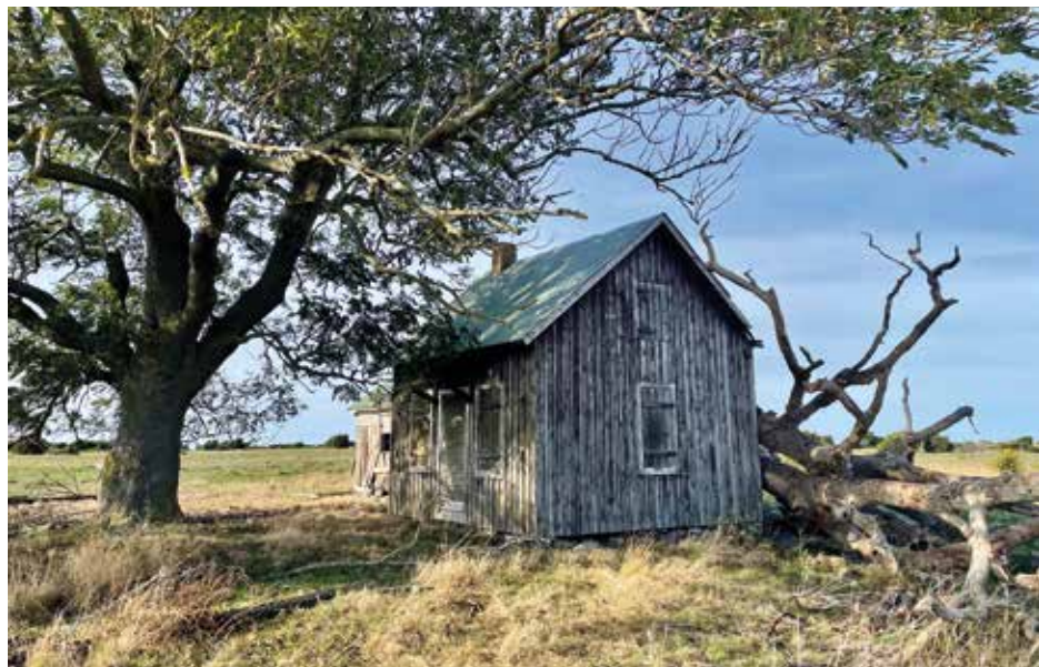
Huset på Utholmen 2024.

Både före, under och efter fyrtiden fortgick ett omfattande holmbete på Utholmen – det vill säga att betesdjur, ursprungligen sim- mande när det gällde hästar och nötboskap, fördes ut till holmen sommartid. Enligt en annons i Gotlands Läns Tidning år 1853 sägs holmen ”i wanliga år kunna sommarföda 20 stycken storboskap och 60 får ”. Enligt en annan annons, i Gotlands Allehanda som- maren 1880, så auktionerades dessutom hö- och släketäkt på holmen ut till högst- budande. Willy Wöhler förlorade holmen vid sin konkurs i slutet av 1890-talet, men Klinteby's nye ägare, Kronolänsman Svall- ingsson, fortsatte att erbjuda bete på holmen,