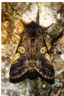
Blåhuva (22).