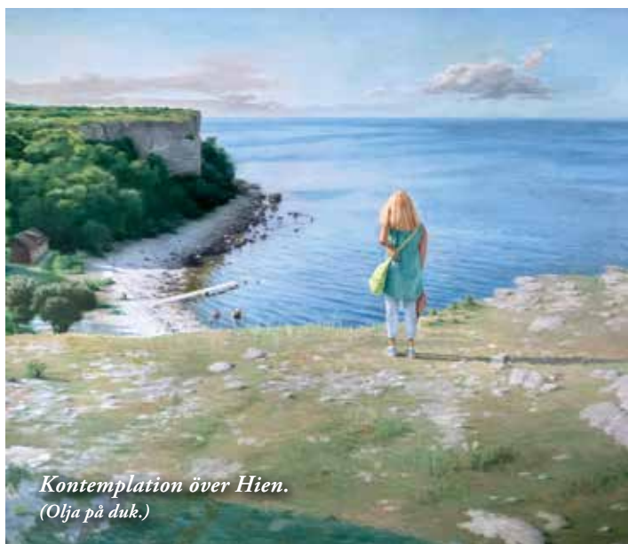
Kontemplation över Hien. (Olja på duk.)

”Det föreställande måleriet är en av pulsådrorna i konsten” säger Fredrik. Och måleriet är brett och tillåtande. Ett kök i stilla solljus, vardagligheter upplyfta till poesi,