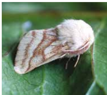
Mindre snabelsvärmare (6).