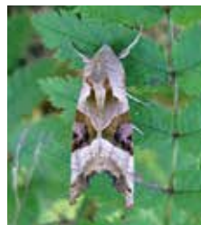
Tandfly (19).