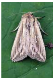
L-tecknat gräsfly (20).