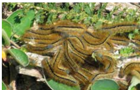
Larver av ängsringspinnare (8).

Under juni ökar givetvis artrikedomen i och med sommarens intågande. En av de tidiga sommararterna är lerfärgad rotfjäril (11), som är en liten, oansenlig nattfjäril. Det intressanta med denna är att det är en ganska sent invandrad art på Gotland. Första fyndet gjordes 1983. Två år senare gjorde jag det första fyndet för Karlsö. Den är numera väl etablerad här på ön och vanlig uppe på gräsmarkerna. Fjärilen flyger främst tidigt på kvällen.