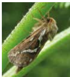
Lerfärgad rotfjäril (11).

Till 'ädelspinnarna' hör två mycket vanliga arter på ön. Det är ängsringspinnare (7) och gräsulv (9). Hanar av bägge arterna kan flyga under soliga dagar eller i kvällningen främst i slutet av juni och i juli. Men oftare träffar man på deras larver (8 och 10) under tidig försommar. Man ska undvika att ta i sådana håriga larver. I avskräckande syfte kan deras behåring ge upphov till klåda eller allergi.