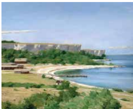
Norderhamn, utsikt från Stora förvar. (Olja på pannå.)