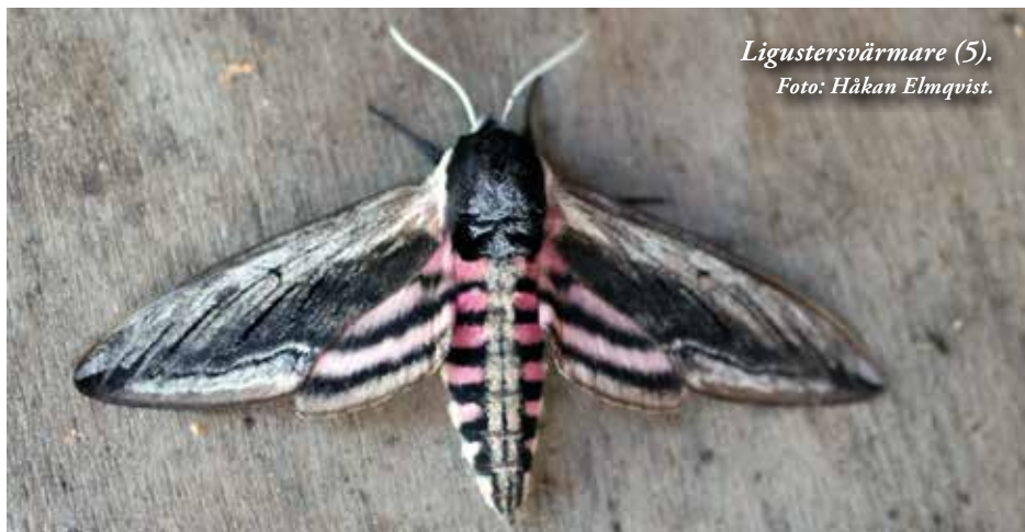
Ligustersvärmare (5).