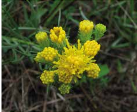
Gullborste med de första blommorna, Stora Karlsö. 3 september 2006.