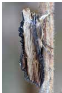
Flenörtskapuschongfly (18).