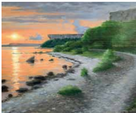
Stilla soluppgång i Hien. (Olja på pannå.)

Årets utställning i restaurangen på Stora Karlsö pågår mellan den 17 maj och 23 augusti.