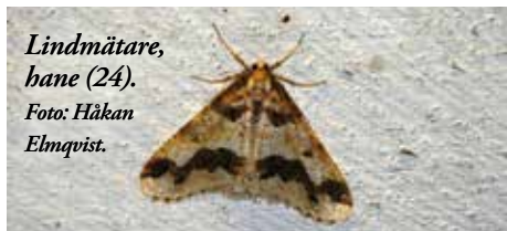
Lindmätare, hane (24).