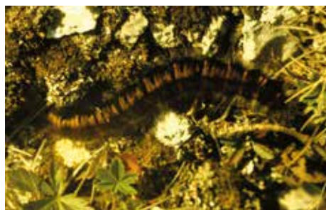
Larv av gräsulv (10).