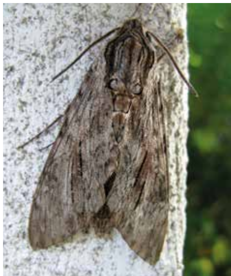
Åkervindesvärmare (21).