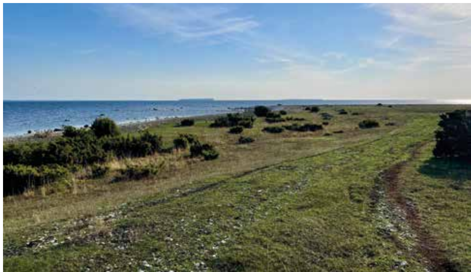
Utsikt mot Karlsöarna.