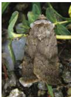
Brunhalsat jordfly (4).