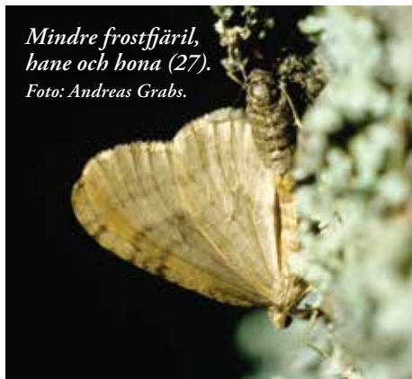
Mindre frostfjäril, hane och hona (27).