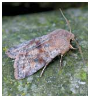
Större sälgfly (3).