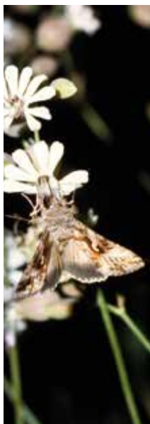
Gammafly (13).