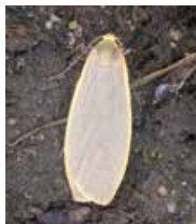
Askgrå lavspinnare (15).