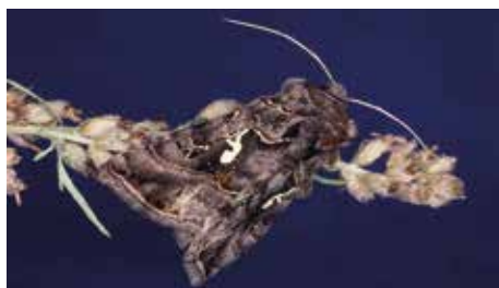
Silverlinjerat metallfly (16).