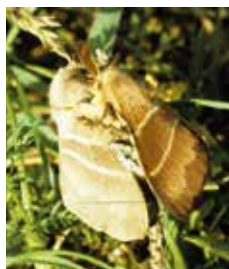
Gräsulv, hona och hane (9).

12 cm är Sveriges största fjäril. Populärt för guiderna att kunna visa upp för besökarna när de stöter på en sådan. Fjärilen är nämligen ganska vanlig på Karlsö men kan vara svår att träffa på. Man får ge sig ut mitt i natten med lampa och kolla på blommor. Fjärilen besöker gärna syren, som det ju finns några buskar av i Hien, men även blåeld. Mindre snabelsvärmare (6), som också är vanligt förekommande, uppträder redan i skymningen och är därför lättare att få se.