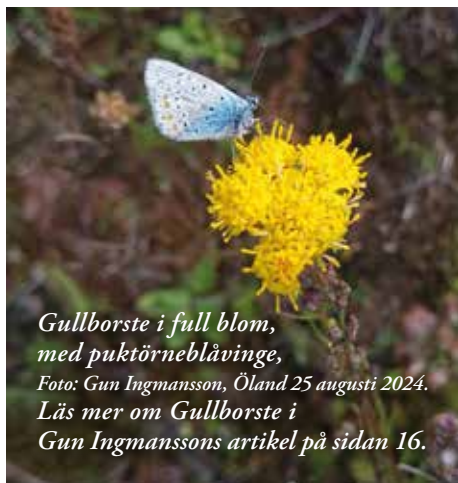
Gullborste i full blom, med puktörneblävinge, Foto: Gun Ingmansson, Öland 25 augusti 2024. Läs mer om Gullborste i Gun Ingmanssons artikel på sidan 16.

Material till Karlsöbladet nr 3–4, 2025 ska vara redaktören tillhanda senast 1 oktober 2025.