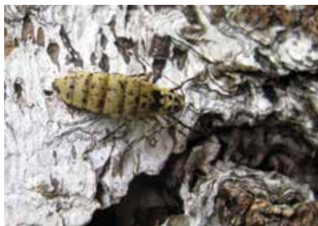
Lindmätare, hona (25).