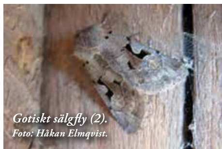
Gotiskt sälgfly (2).

fällor och lockbete. En del arter är även mer eller mindre dagaktiva och man skrämmer oftast upp dem under vandringar på ön. Vissa är även blombesökare på dagen och därför lättare att studera.