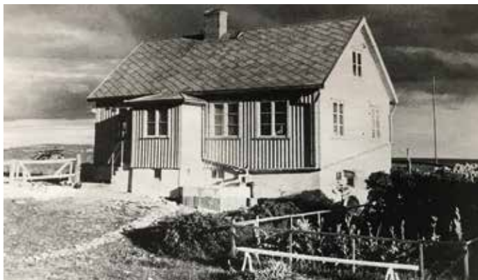
Fyrmästarens nya hus med värmeledning och torrdass inomhus, på 1930-talet.

”Lotsverkets tjänstebåt var en liten öppen snipa som var i dåligt skick redan 1934 men